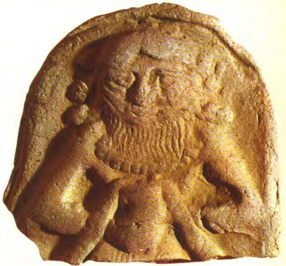
Tableta con representación de Ea, dios de las aguas y del mundo subterráneo (Museo del Louvre, París).

Con este material parece que no habría de ser difícil restaurar la cronología de Mesopotamia, pero hemos de reconocer que la historia de los acontecimientos y el orden de su sucesión son muchísimos más oscuros que en Egipto. Los primitivos sumerios mezclaron de tal manera la fábula con la historia, que, a pesar de haber recuperado varias tablas de cómputos y listas de reyes, no podemos decir todavía que andamos sobre terreno firme. En primer lugar, según las ta-